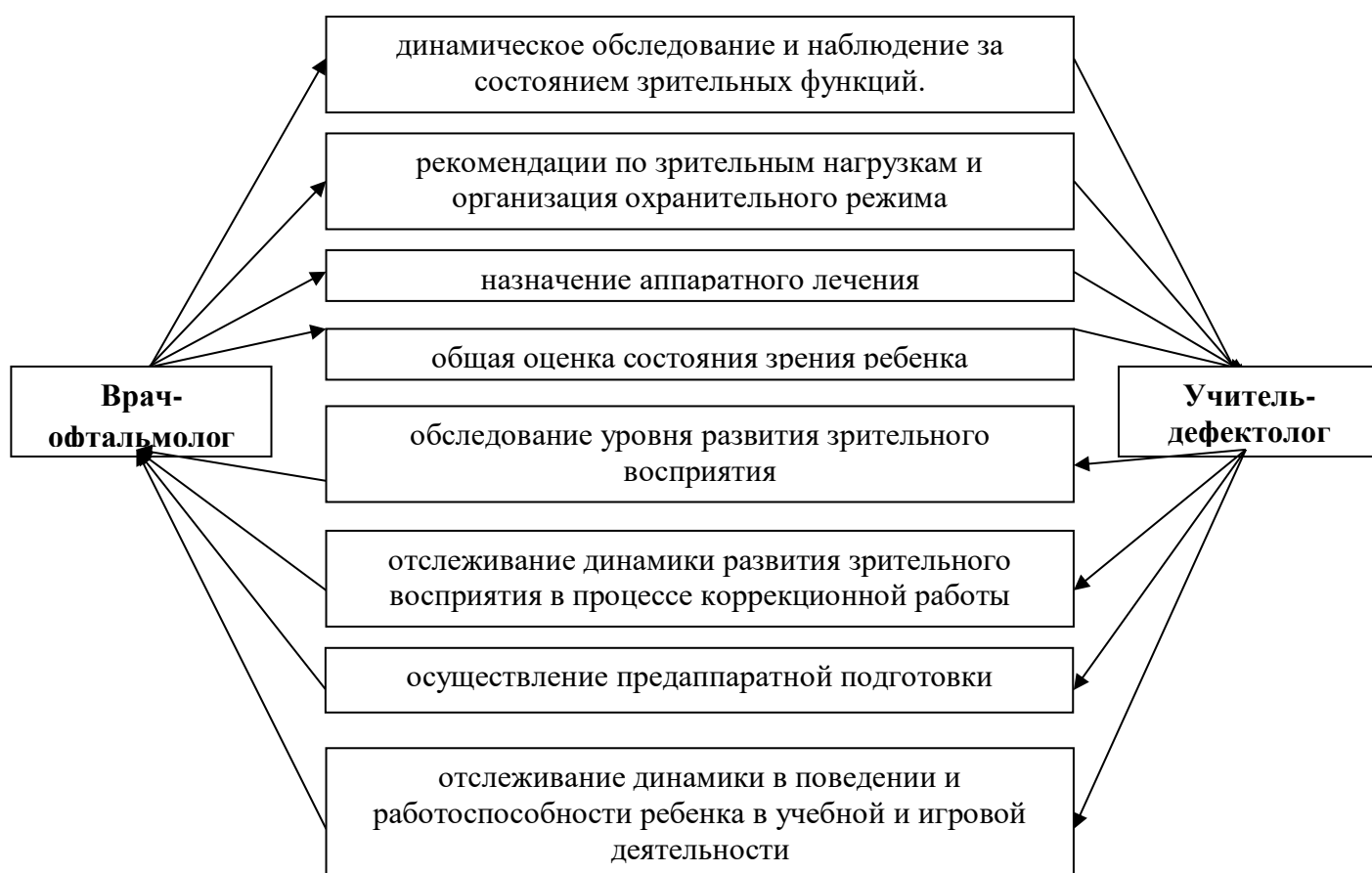
Схема 2. Взаимодействие врача-офтальмолога и учителя-дефектолога.

Коррекционно – развивающая работа учителем-дефектологом осуществляется: